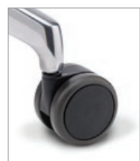
für harte Böden