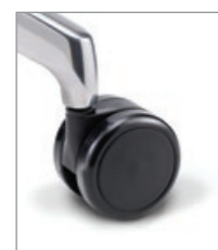
für weiche Böden