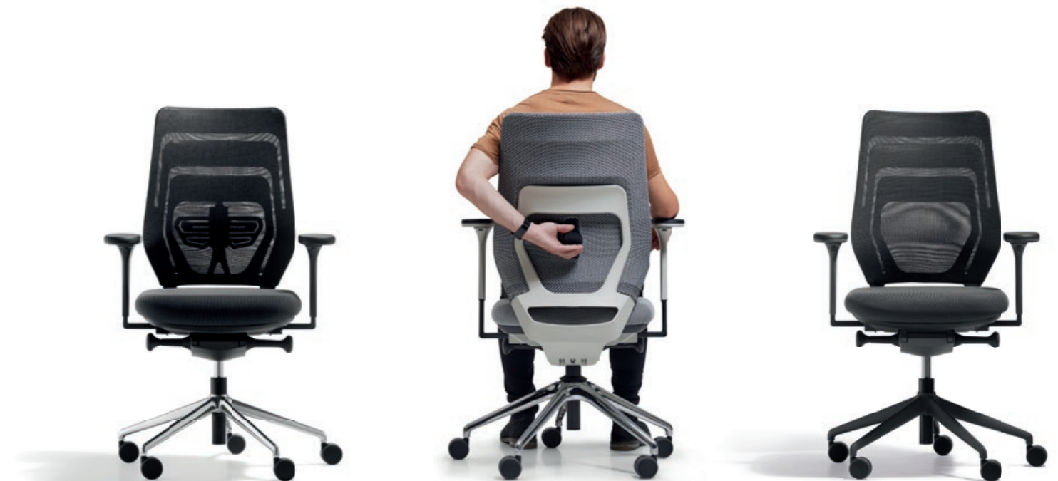
Rückenlehne mit Lumbalfunktion

Optional kann die Rückenlehne mit einer adaptiven Lumbalfunktion ausgestattet werden. Die Lumbaleinstellung ist 70 mm in der Höhe und 25 mm in der Tiefe justierbar. Der Nutzer kann beim Sitzen die für ihn optimale Position bequem einstellen.